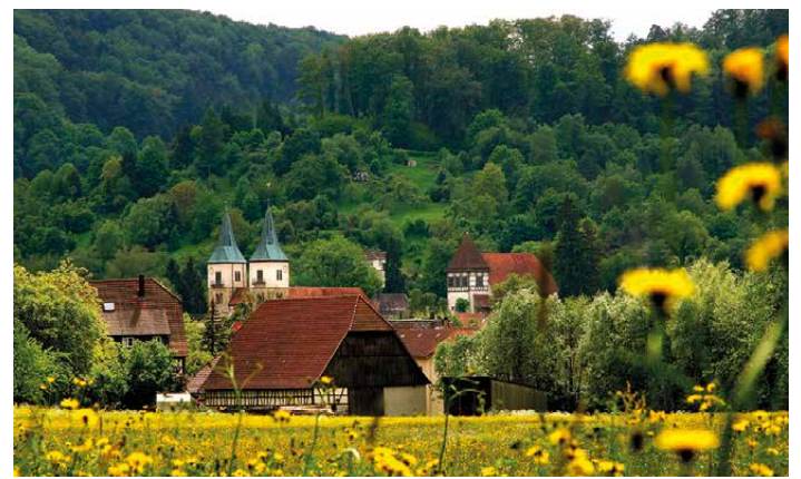
Blick auf Murrhardt