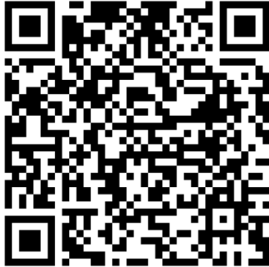
QR-Code Meldeplattform Asiatische Hornisse

Württemberg. Dies ist über die Meldeplattform auf der Homepage der Landesanstalt für Umwelt (LUBW), aber auch über die kostenlose „Meine Umwelt-App“ möglich: