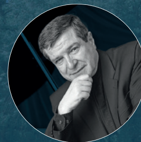
JACQUES ROUVIER Salzburg